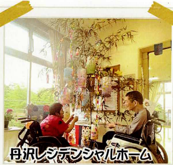
丹沢レジデンシャルホーム

短冊や七夕飾りを楽しみました。7/7 当日の昼食は『七夕そうめん』や『星☆ゼリー』が提供されました。