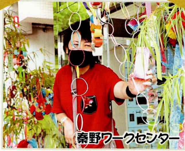
秦野ワークセンター

七夕飾りを作って願い事を書いた短冊を飾りました。織姫と彦星が逢えるように、活動室の壁にはみんなで作った天の川が流れています。