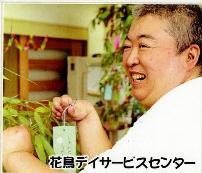
花鳥デイサービスセンター

短冊や七夕飾りを楽しみました。7/7 当日の昼食は『七夕そうめん』や『星☆ゼリー』が提供されました。