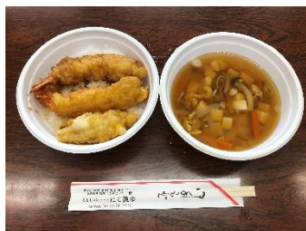
会議終了後は、出前のお弁当でランチをとりながら、和気あいあいと情報交換が進みました

【あとがき】上記は、ナビ主催の会議では久しぶりの対面開催でした。どんどん挙がる意見をホワイトボードに書き連ねていくに従い、参加されている方の集中力と会場のボルテージが上がり、化学変化が起きて結論が導き出されました。対面開催の良さを満喫した会議でした。楽しかった！