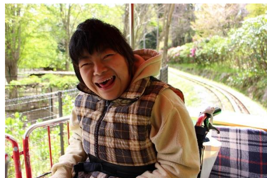
ガタンゴトン揺れる列車は楽しい！！