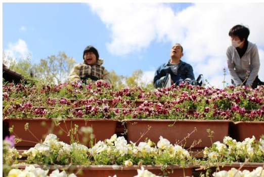
天気も快晴でした。