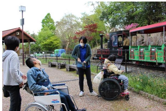
こども列車に乗車